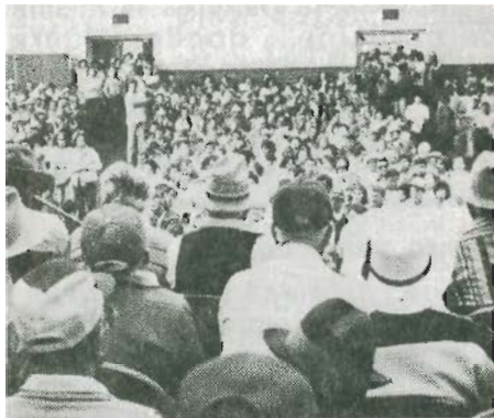
¡En la unión está la fuerza!

Con respecto al programa H-2 de bracerismo, programa que ha servido para el bienestar de los rancheros y ha contribuido a los bajos sueldos en los campos de labor, así como a la proliferación de injustas prácticas laborales, se acordó que se hagan todos los esfuerzos necesarios para terminar definitivamente con tal programa.