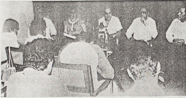
Instantes en que los miembros del Consejo Supremo Electoral dan a conocer las Normas de Ética y Regulaciones de la Ley Electoral.