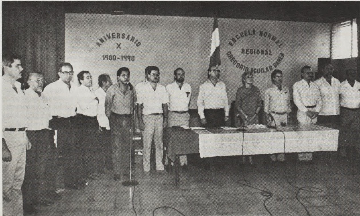
La presidente de la República con su Gabinete de Gobierno en pleno durante su primera sesión en Juigalpa Chontales.

Al final de la sesión la Señora Presidente, en breve mensaje a los señores alcaldes y a las autoridades regionales y a los ministros aquí presente exhortó a todos a que aumentáramos la comunicación entre todos, utilizáramos las vías existentes, los mecanismos existentes para mantener un mayor contacto entre autoridades municipales, regionales y nacionales con el propósito de ir viendo con tiempo los problemas que se presentan en las regiones, las posibles soluciones, los proyectos de desarrollo que entidades internacionales quieren promover en la Región. Y coordinar todo esto en beneficio de la poblaciones de todos éstos municipios y de toda ésta importante región del país.