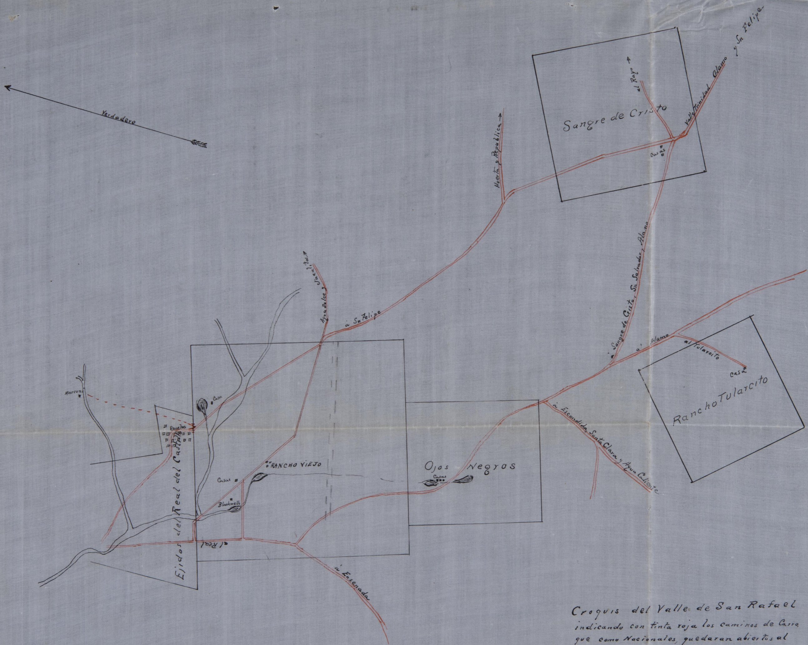
Croquis del Valle de San Rafael indicando con tinta roja los caminos de Carra que como Nacionales, quedaran abiertos al publico.

Ensenada Mayo 22, 1905 El Sindico D. J. [Signature]