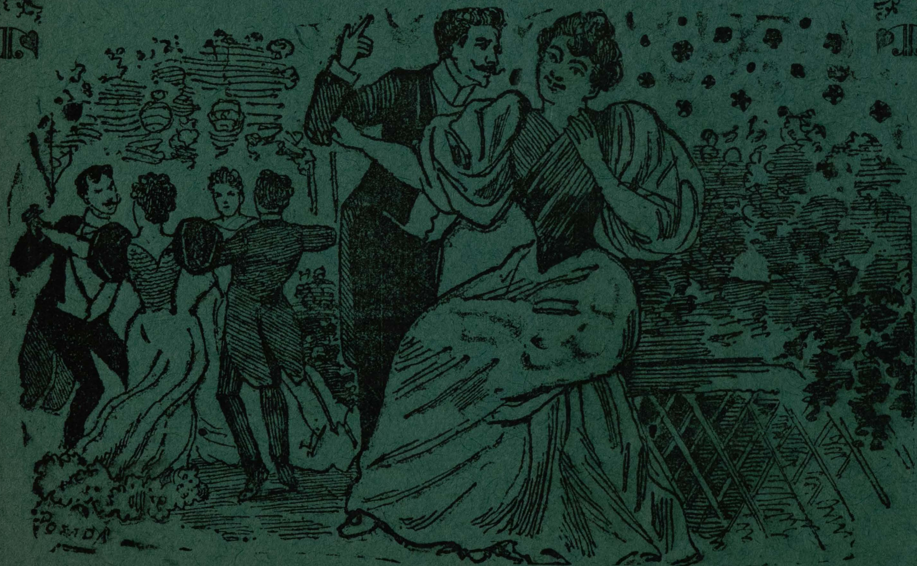
México, 1900.—Tip. de A. Vanegas Arroyo, Sta. Teresa núm. 1. (13)

que me sube al rostro la sofocación. Aunque me digas que no, yo ya sé que vas al baile no sabes tú que yo he sido cocineberebero antes que fraibiribile. Ven, niña de mi vida, y escucha mi canción; no olvides lo que sufre por tí mi corazón. Las chicas de este barrio que quieren hoy lucirse acuden al Disloque de este modo disfrazas, y así con los peroles y así con las cucharas de fijo que llamamos la atención en el solar.