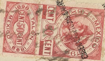
Figura B 1879.

le. Secretario del D. Ayuntamiento. Ensenada