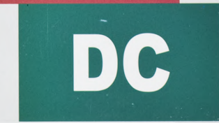
PARTIDO DEMOCRATA CRISTIANO DE HONDURAS