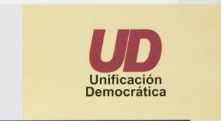
UD Unificación Democrática