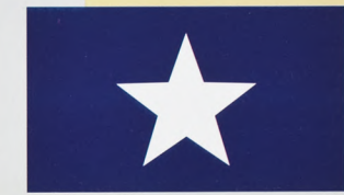
PARTIDO NACIONAL DE HONDURAS