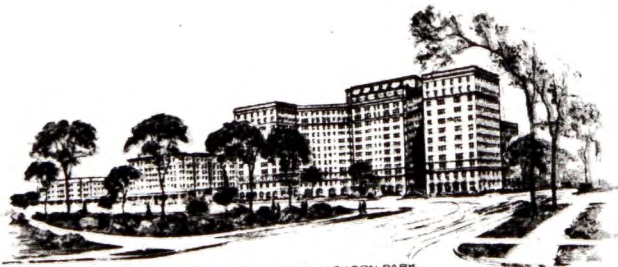
FRONTING SOUTH ON JACKSON PARK 56TH STREET AND THE LAKE