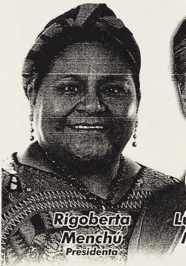
Rigoberia Menchú Presidenta