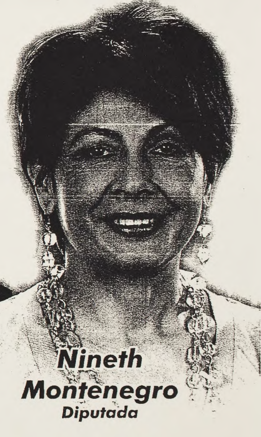
Nineth Montenegro Diputada

www.encuentroporguatemala.org.gt www.rigobertapresidenta.org