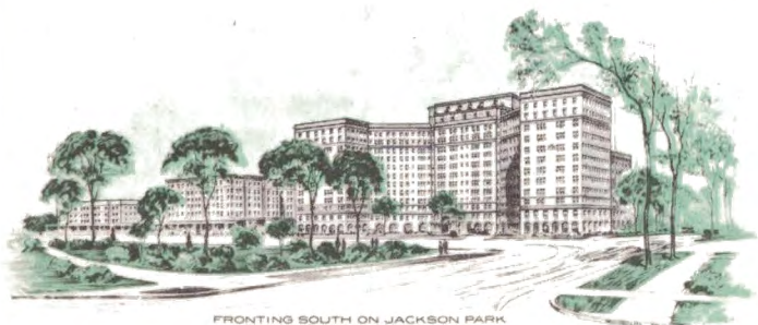
FRONTING SOUTH ON JACKSON PARK 56TH STREET AND THE LAKE