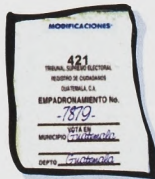
Sellos de empadronamiento