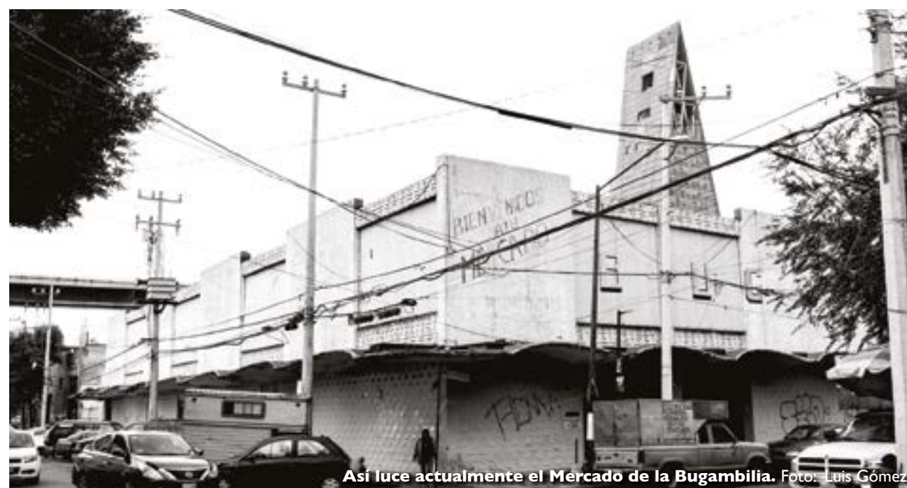
Así luce actualmente el Mercado de la Bugambilia.

MERCADO LA BUGAMBILIA Bugambilia 163 Col. Santa María la Ribera