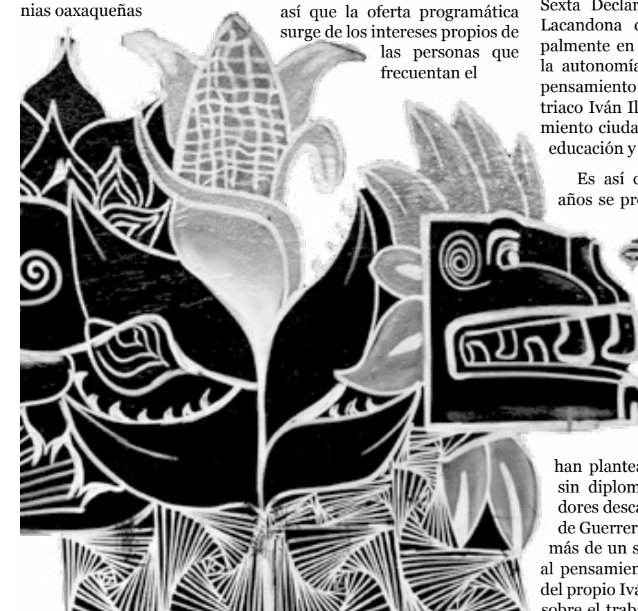
Imagen de graffiti, Skate park San Cosme. Autor: Dosseres Htk.