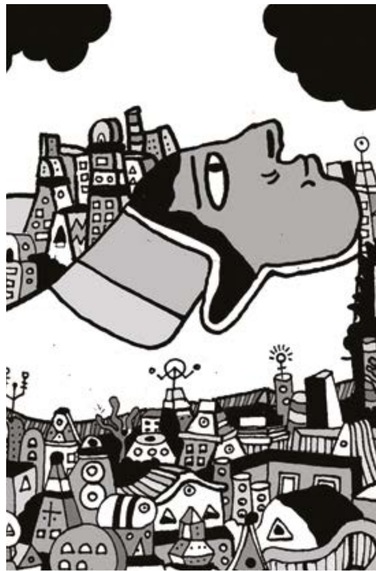
Ilustración: Rodrigo Simanca

Tal vez el próximo año ya no pueda pagar la renta y tendremos (yo y mis cuatro gatos) que encontrar un nuevo lugar. Tal vez en el sur profundo o más al norte, donde todavía las rentas no se disparan. Pero siento que no sería lo mismo: algo aquí me gusta mucho y no tiene nada que ver con el Kiosco Morisco (que es hermoso y funciona como símbolo para identificar a la colonia pero que no es la colonia); o con la sobrevalorada pozolería local (que tiene sucursales que no se las identifica con las colonias en donde están). Es otra cosa. Si me voy, extrañaría a la gente, el mercado, el veterinario que ya conoce a mis gatos, las tortas, las calles, los perros, y en general, ese noble sentimiento de sentirse cercano.