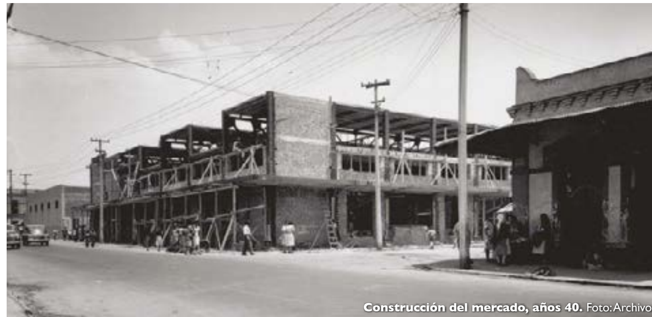
Construcción del mercado, años 40.