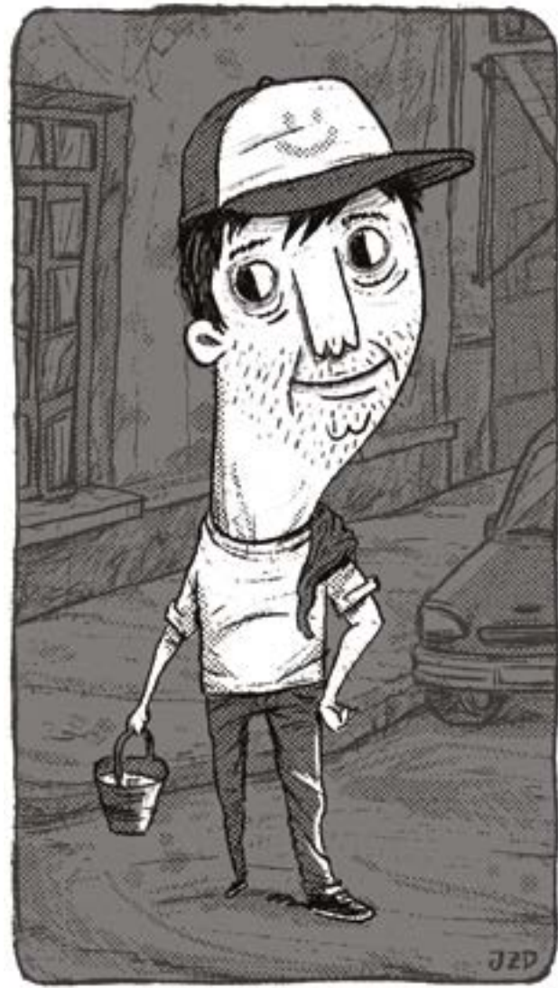
Ilustración: Jozé Daniel