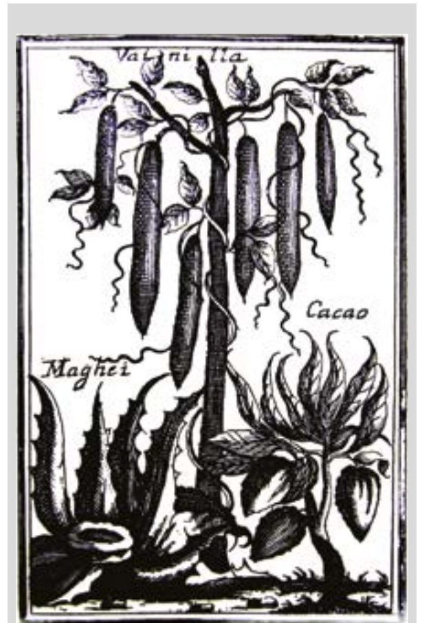
Plantas comestibles americanas: Giovanni Francesco Gemelli Careri, Viaje a la Nueva España