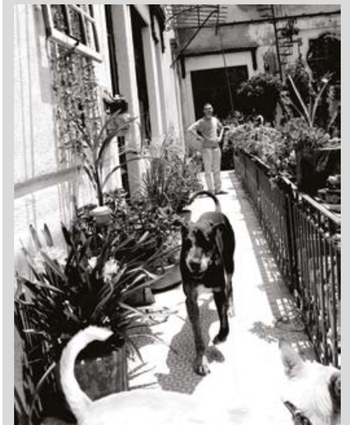
En el interior de la Verde Morada: Foto: Luis Gómez

Casas que alberga iniciativas comunitarias y sustentables, gracias a un grupo que es parte de diversos proyectos culturales. Además, es un huerto colectivo en el que se muestran diversas técnicas de agricultura urbana, talleres para relacionarse de distintas maneras con el entorno ciudadano, biblioteca, estancia y lenguas indígenas.