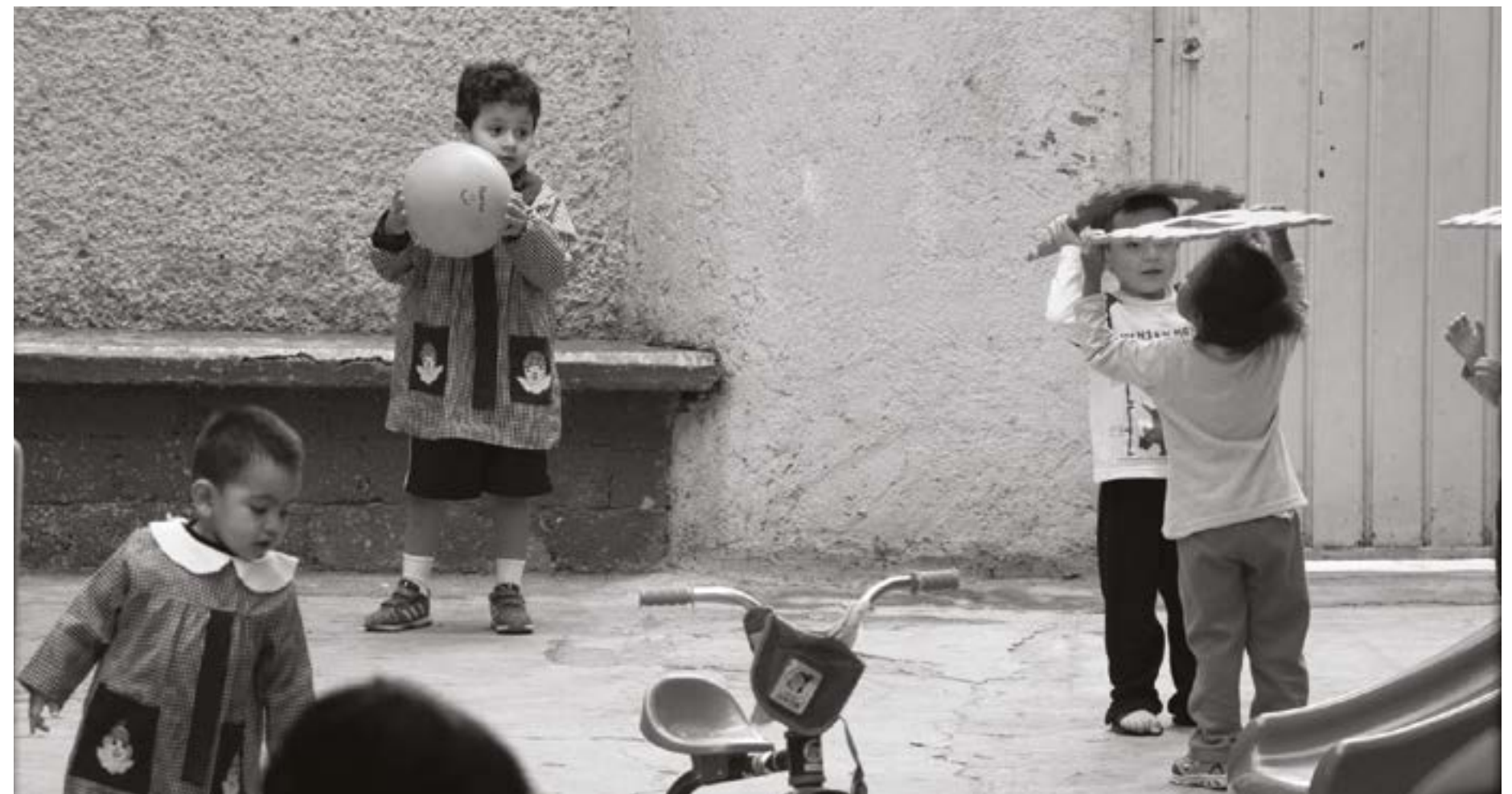
Niños de la estancia juegan durante un receso. 3

Rodeada por importantes avenidas, cerca de poblaciones flotantes de trabajadores, dueña de una historia y un presente particulares Santa María la Ribera ha resistido con relativo éxito la especulación inmobiliaria y la escalada de precios de servicios sufridos por otros barrios tradicionales de la Ciudad de México. ¿Cuál es el futuro próximo de esta colonia? ¿Sucumbirá a la gentrificación, se convertirá en una colonia de interés social, o logrará encontrar un equilibrio a través de la vida en común de sus integrantes así como gracias a las acciones de individuos y organizaciones? El primer número de Rivera Ribera, creado por y para los habitantes del barrio, intenta contestar esta clase de preguntas: comenzamos.