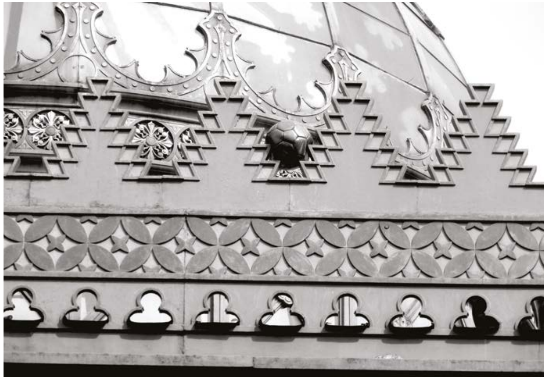
Detalle del Kiosko Morisco.