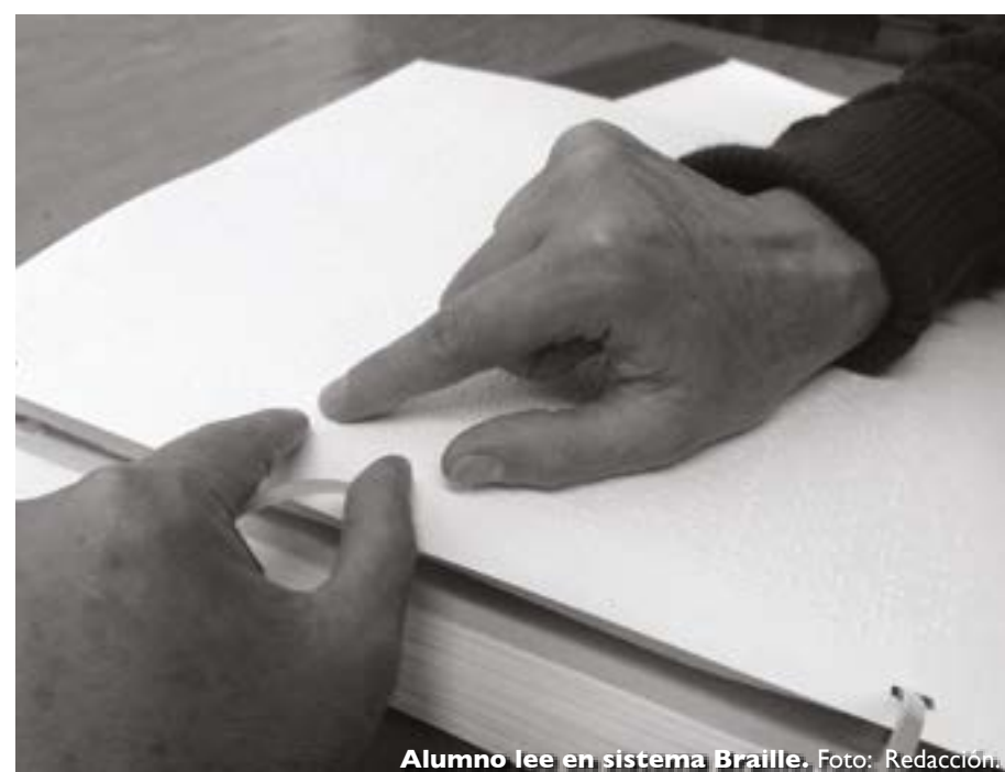
Alumno lee en sistema Braille.

Hay también un consultorio de masoterapia, en donde trabajan algunos de los alumnos de la escuela, recibiendo la