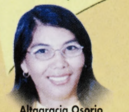
Altigracia Osorio Alcaldesa San Juan De Flores