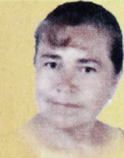
Sonia Pantoja Diputada 85