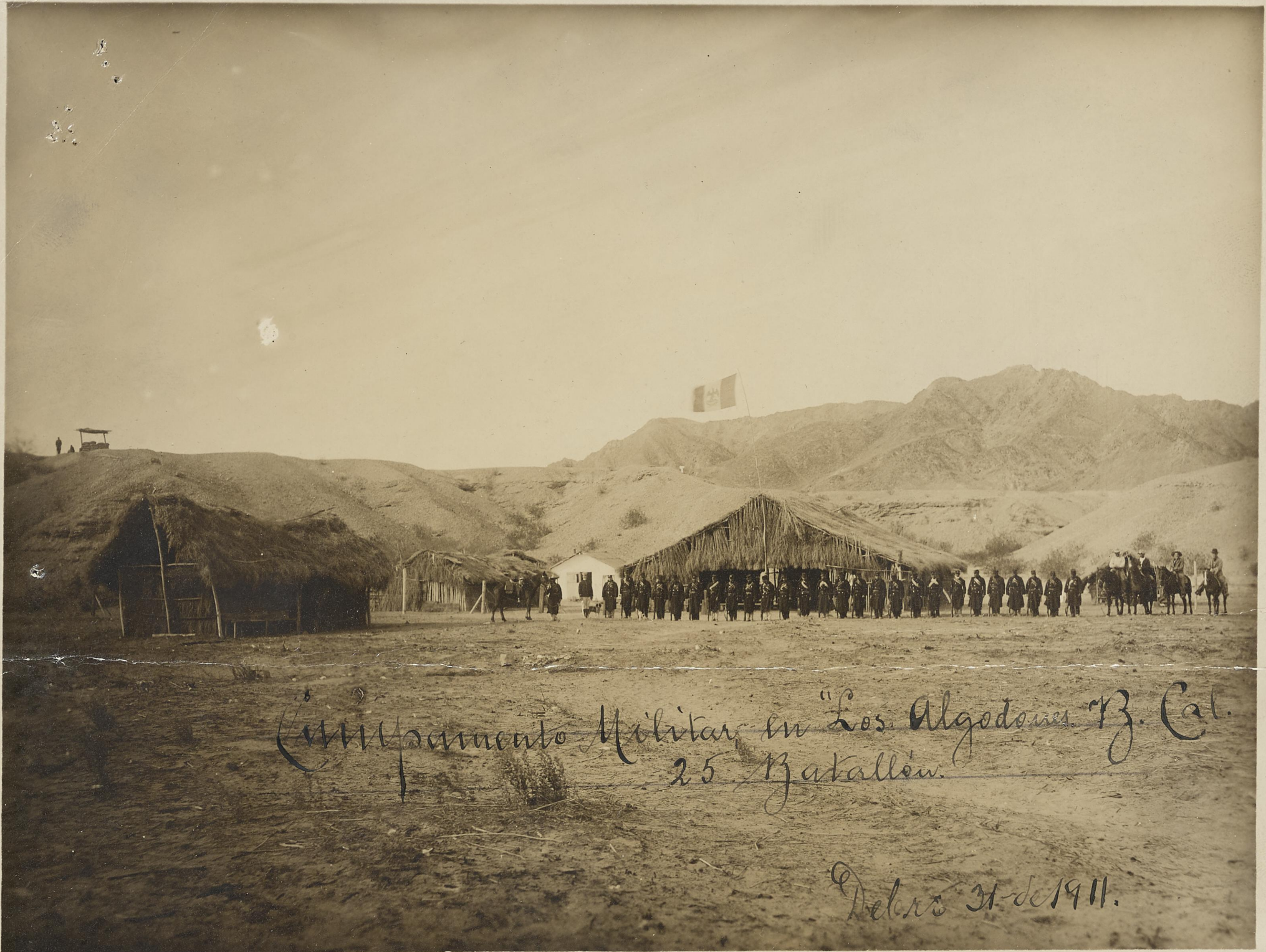
Campamento Militar en "Los Algodones" B. Cal. 25 Batallón.