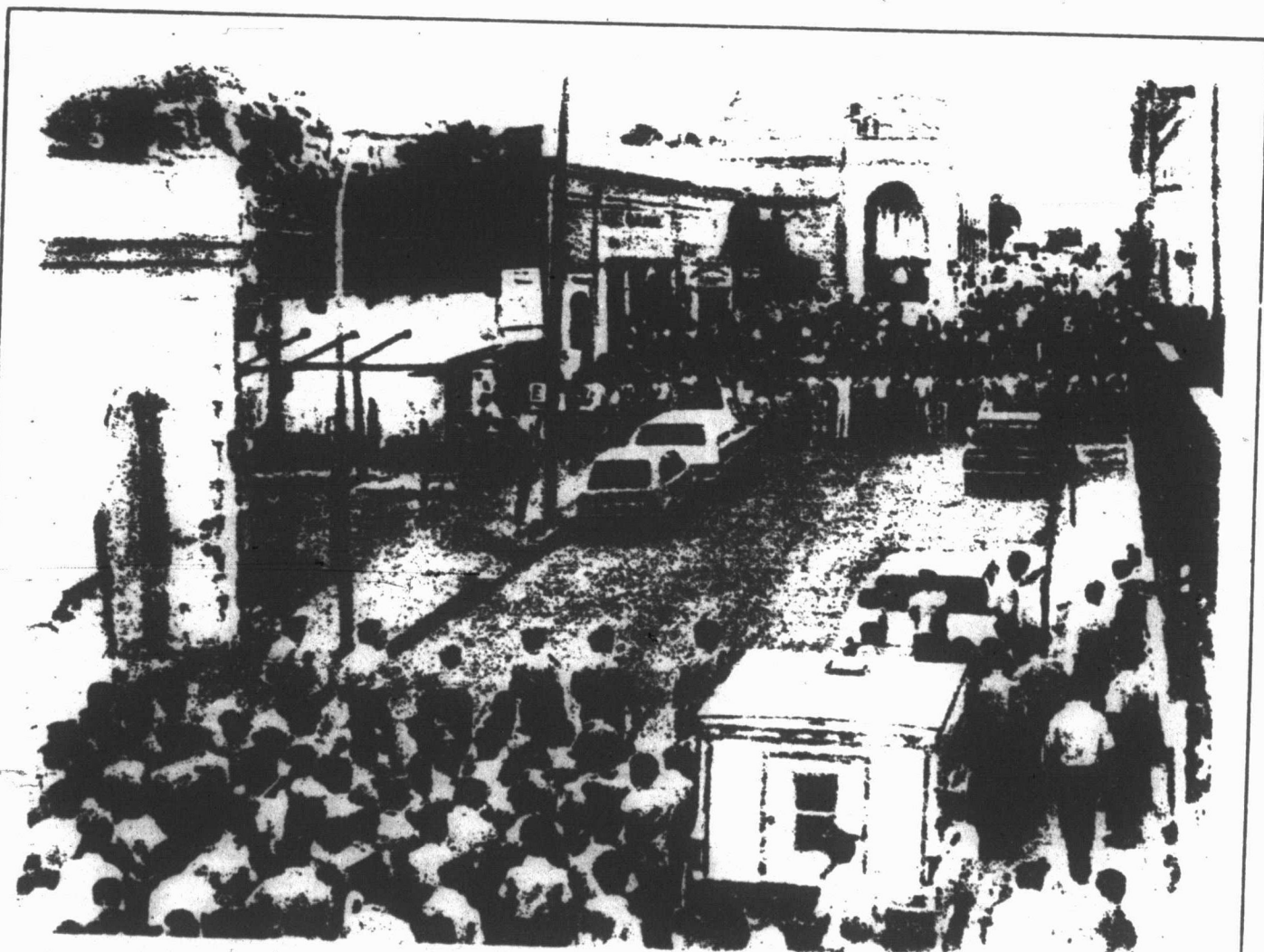
UNA MUESTRA DE LA COMBATIVIDAD DE LAS MASAS ESTUDIANTILES EN SINALOA

el papel que ya realizó años atrás, como un destacamento más del proletariado revolucionario. Pero también ya han evidenciado el gran trabajo que los militantes revolucionarios y todos los elementos avanzados tenemos que realizar de frente a eso, de la necesidad de una intensa labor de educación política y de organización para guiar esa gran energía revolucionaria, que hoy apenas ha dado pequeñas muestras, hacia un vigoroso movimiento revolucionario.