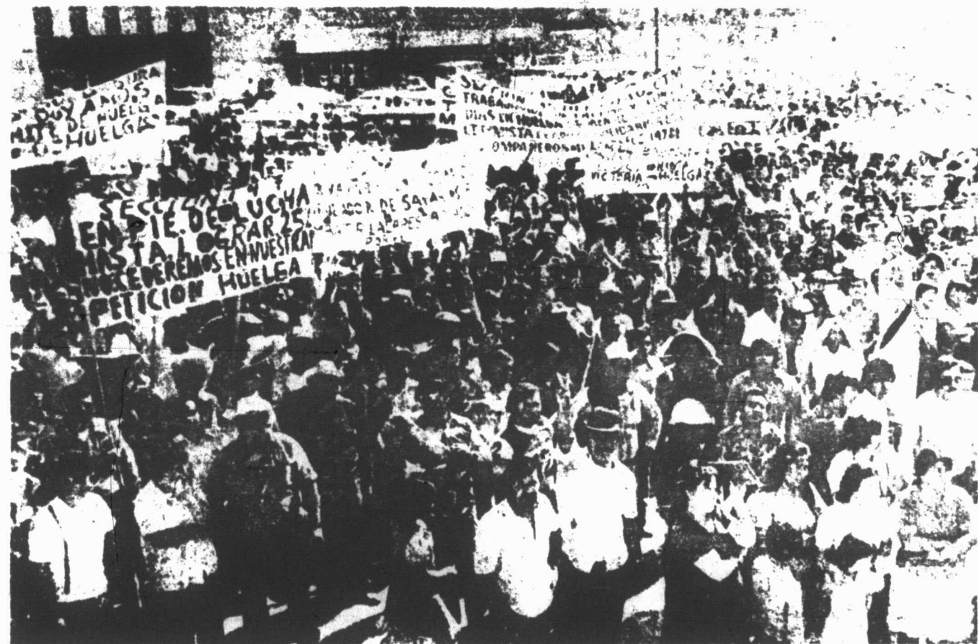
GRAN SOLIDARIDAD LEVANTÓ LA HUELGA DE AHMSA 1 EN MONCLOVA

No hay duda, el futuro del movimiento, por todo eso, es halagador. Pero esto mismo reclama una labor más intensa de los militantes revolucionarios, que haga posible que ese previsible auge de la lucha obrera sea aprovechado para arribar a un estadio superior de la lucha del proletariado contra la dominación burguesa, y que sea un paso decisivo para la construcción del movimiento nacional único de la clase obrera *