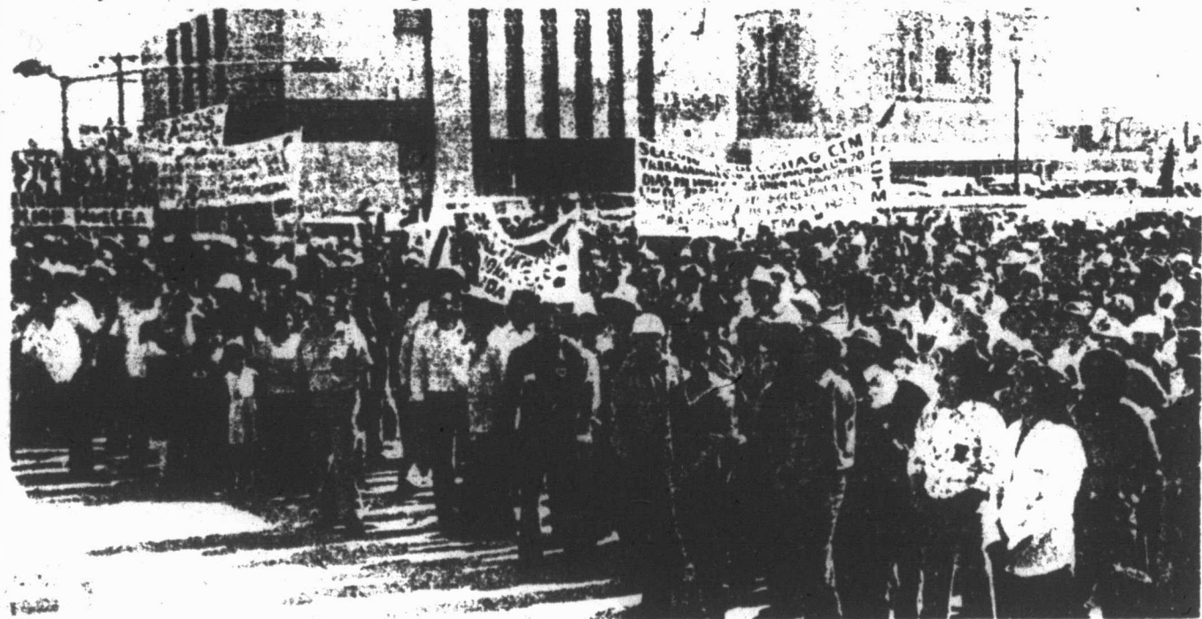
HUELGA DEL 10 DE MARZO DE 1980 EN AHMSA 1

Por último como parte de la preparación, hay que iniciar desde ahora una labor de agitación y propaganda hacia los demás sectores obreros y populares de la región: AHMSA 2, KIKAPOO, COMSA, Fundición, Ferrocarrileros, etc., entre los obreros, hacia los estudiantes, "colonos", etc., y realizar manifestaciones y mítines fuera de la planta para informar de la movilización que se está preparando y llamarlos a la solidaridad revolucionaria, a que se incorporen también a la lucha con sus propias demandas, para darle forma a un amplio movimiento en la región que se fusione con la lucha de los obreros y demás trabajadores en otras partes del país.