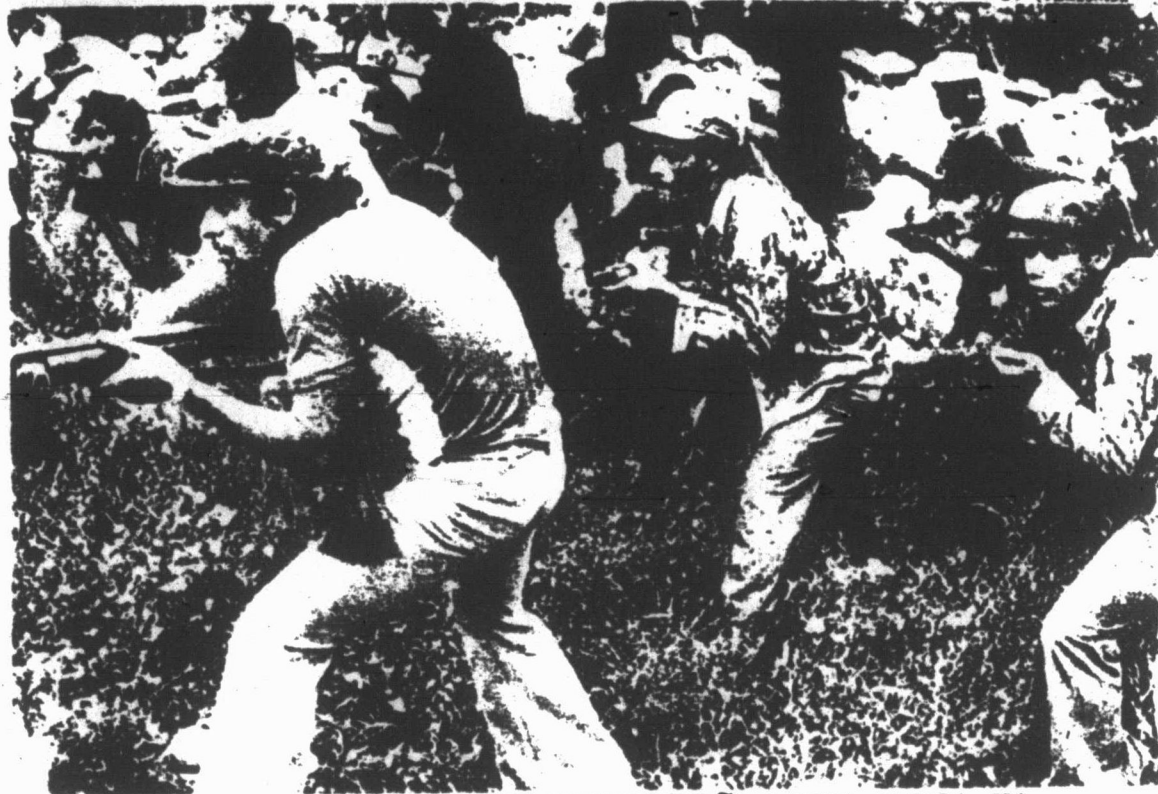
LOS REVOLUCIONARIOS SALVADOREÑOS MUY CERCA YA DE LA OFENSIVA FINAL.